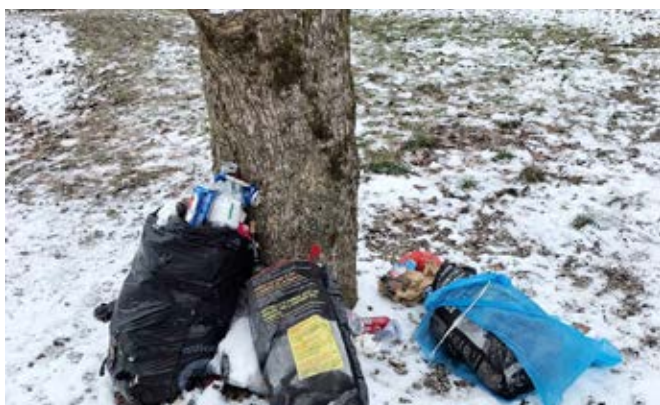
Wer holt das ab?