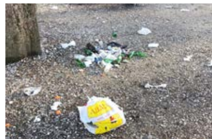
Freier Platz mit Abfällen

Auch laute Musik oder grosse Partys gehören nicht in den Wald.