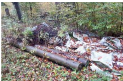
Resten einer Baute